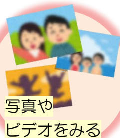
写真 しやうしん や ビデオをみる