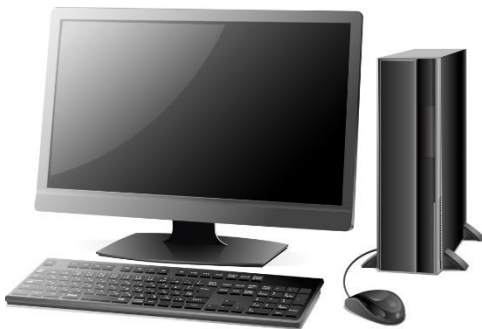
デスクトップパソコン